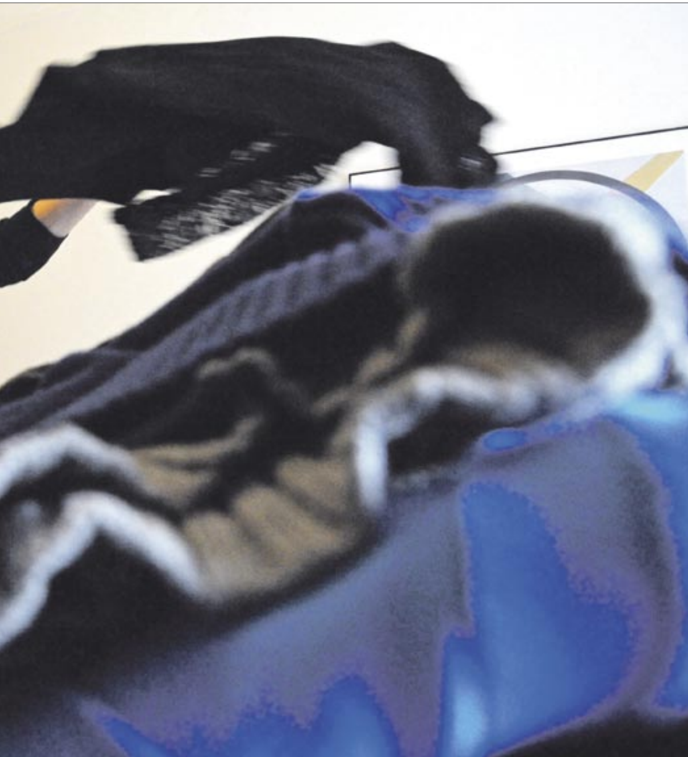
Bilsted sorterer tøjet med hård hånd. Dur – dur ikke.